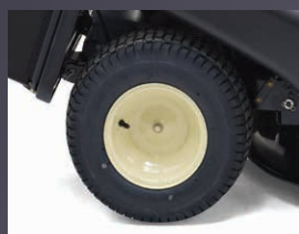
LARGES PNEUS SPÉCIAL GAZON