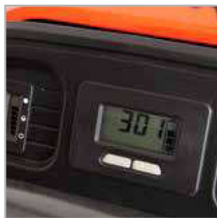
TABLEAU DE BORD PRATIQUE Ce tableau de bord de luxe montre ce dont votre machine a besoin. Il contient une jauge à carburant et un compteur d'heures. La fonction d'interaction prévient l'utilisateur lorsque la machine est en maintenance.

CONTRÔLE DE VITESSE Vitesse de conduite infiniment variable. Ajustez votre vitesse rapidement et facilement.